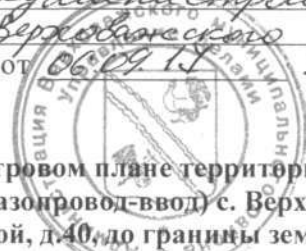
Схема границ земель или части земельного участка на кадастровом плане территории для размещения объекта: "Участок газораспределительной сети (газопровод-ввод) с. Верховажье Верховажского района Вологодской области по ул. Первомайской, д.40, до границы земельного участка с кадастровым номером 35:07:0501004:0004, код стройки 19\14-000225"

Утверждена постановлением администрации Верховажского района от 06.09.17 № 610