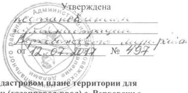
Схема границ земель или части земельного участка на кадастровом плане территории для размещения объекта: "Участок газораспределительной сети (газопровод-ввод) с. Верховажье Верховажского района Вологодской области по ул. Тендрякова, д.9, до границы земельного участка с кадастровым номером 35:07:0502004:15, код стройки 13\14-000112"